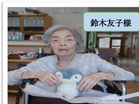
お誕生日おめでとうございます！