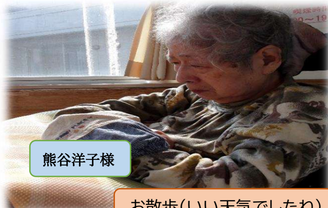
お散歩(いい天気でしたね)