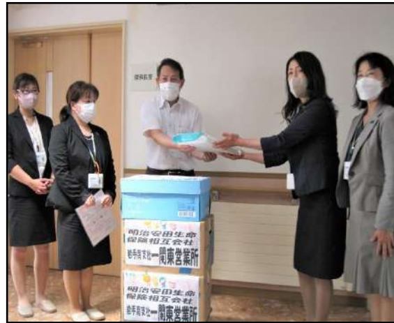
【明治安田生命一関東営業所様】