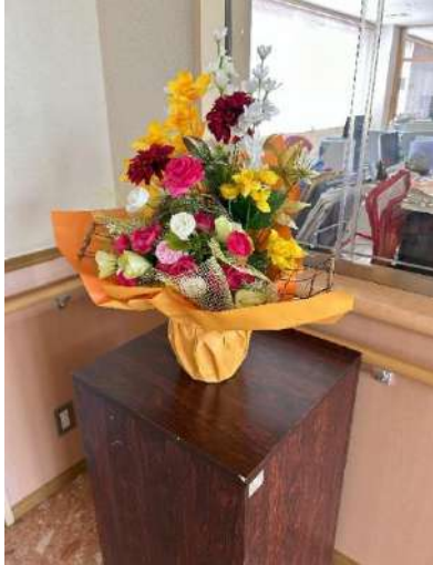
【一関婦人ボランティアの会様】