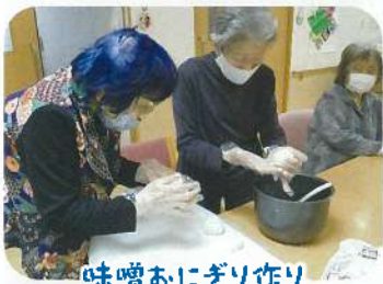
味噌おにぎり作り