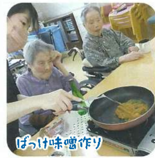
ぼっかけ味噌作り