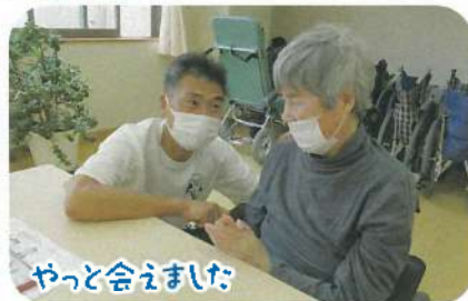
やっと会えました