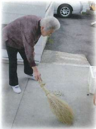
手作りの箒です。コキアで作りました！