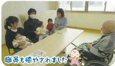
職員も癒やされました