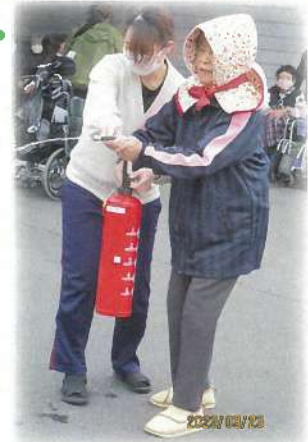
防災頭巾と消火器避難訓練の様子です。